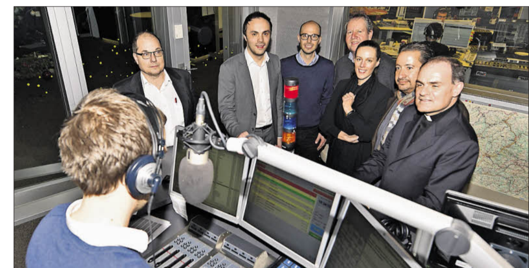
Am 23. Dezember findet wieder der große Spendenmarathon mit prominenter Unterstützung statt.