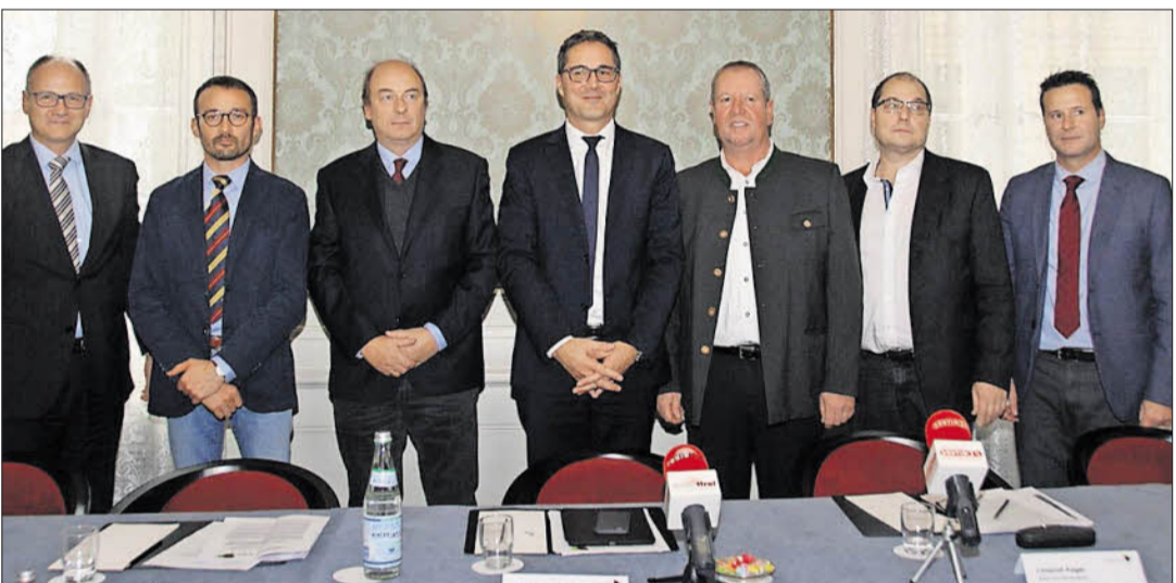
Gemeinsam für die gute Sache: Zahlreiche Organisationen stehen hinter „Südtirol hilft“.