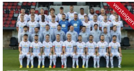
Fliegen Sie mit dem FC Südtirol nach Cagliari