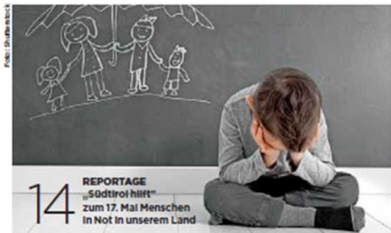
REPORTAGE „Südtirol hilft“ Zum 17. Mai Menschen in Not in unserem Land

„Südtirol hilft“ ist mittlerweile die bedeutendste Hilfsplattform im Land, eine Initiative von Krebshilfe, Bäuerlichen Notstandsfonds und Caritas zusammen mit den Radiosendern „Südtirol 1“, „Radio Tirol“, dem Verlagshaus Athesia und in Zusammenarbeit mit 13 Hilfsorganisationen.