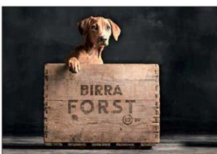
Die große Hilfsaktion von „Südtirol hilft“, die von Spezialbier-Brauerei Forst initiiert, als Partner unterstützt wird, stellt die vierbeinigen Freunde in den Mittelpunkt.

BOZEN. Die Freunde auf 4 Pfoten zählen seit jeher zu den treuesten Begleitern des Menschen. Vom Jagd- und Herdenhund hat sich das Bild heute zumeist zum Familienhund gewandelt. Dieses Jahr stehen die treuen Freunde auf 4 Pfoten im Mittelpunkt der großen Hilfsaktion von „Südtirol hilft“.