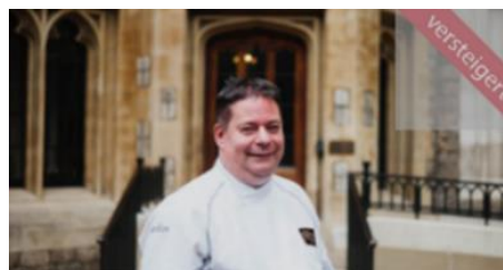
Kulinarische Tour durch London mit dem „Koch der Queen“