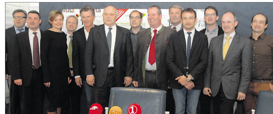
Zahlreiche Mitglieder und Partner haben sich heuer wieder zur Vorstellung der Aktionen von und für „Südtirol hilft“ eingefunden.

„Südtirol hilft“ – und der Spender selbst hat die Chance auf eine einmalige Kreuzfahrt auf dem Traumschiff „MS Deutschland“ während der Dreharbeiten zur gleichnamigen ZDF-Serie für zwei Personen im Wert von über 11.000 Euro. Die Ziehung des Gewinners erfolgt am 27.12. um 8 Uhr live auf Radio Tirol und Südtirol 1. Ermöglicht wurde die Aktion durch die Reederei Deilmann, die Raika Bozen, die Athesia Buchhandlungen und „IN Südtirol“.