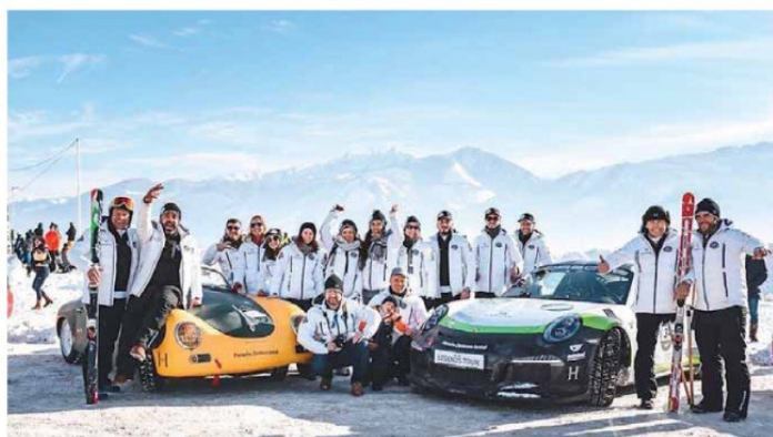
• La Porsche Ice Race si terrà a Zell am See all'inizio di febbraio